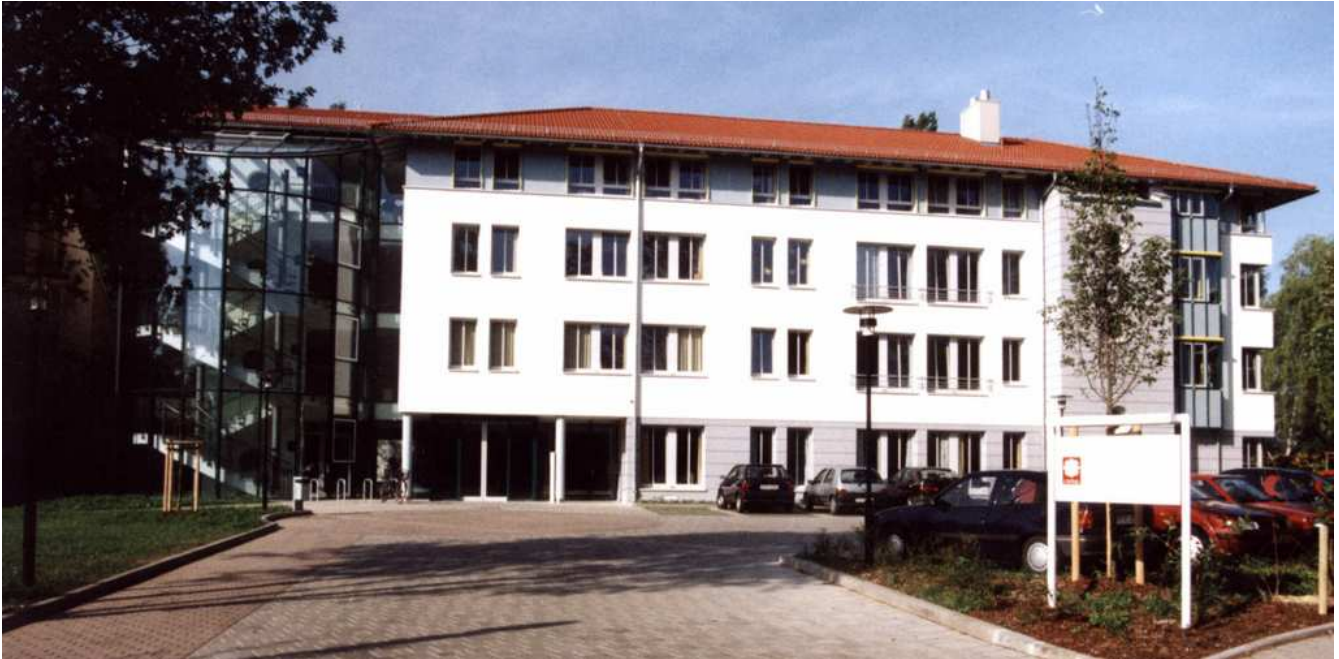
Abbildung: St.-Marien-Krankenhaus Dresden

Sehr geehrte Leserin, sehr geehrter Leser,